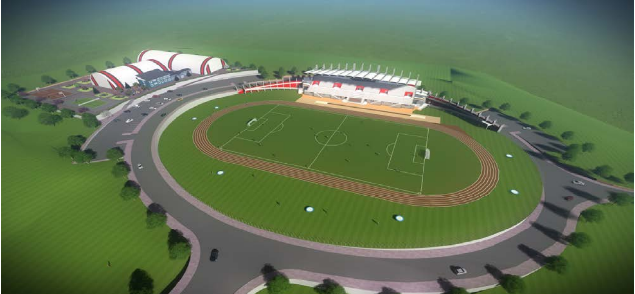
Resim 4. Açık Spor Tesisleri

“Açık ve Kapalı Spor Tesisleri” projesine baėlı olarak, 2017 yılında ihalesi yapılan 40.777 m 2 alana sahip “Açık Spor Tesisleri” yapım işinin, 2017 yıl sonu itibariyle %22’si tamamlanmış olup, inşaat çalışmaları devam etmektedir.