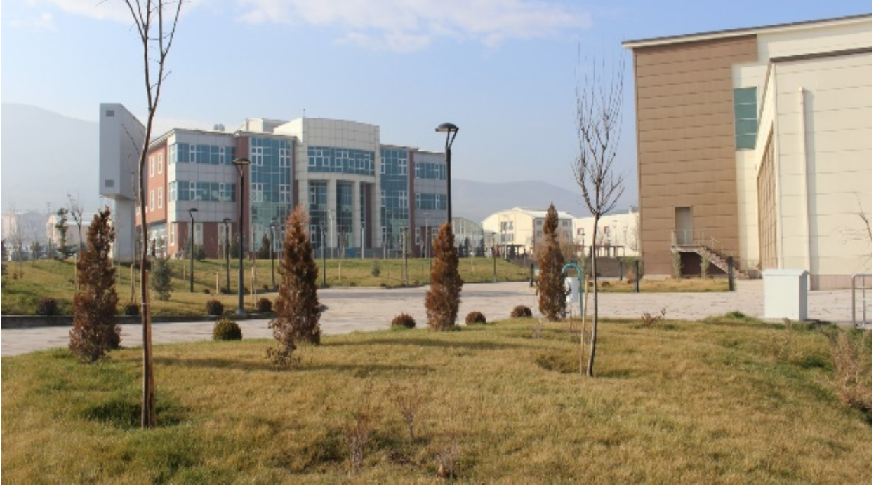
Resim 6. Kongre ve Kltr Merkezi evre Dzenlemesi