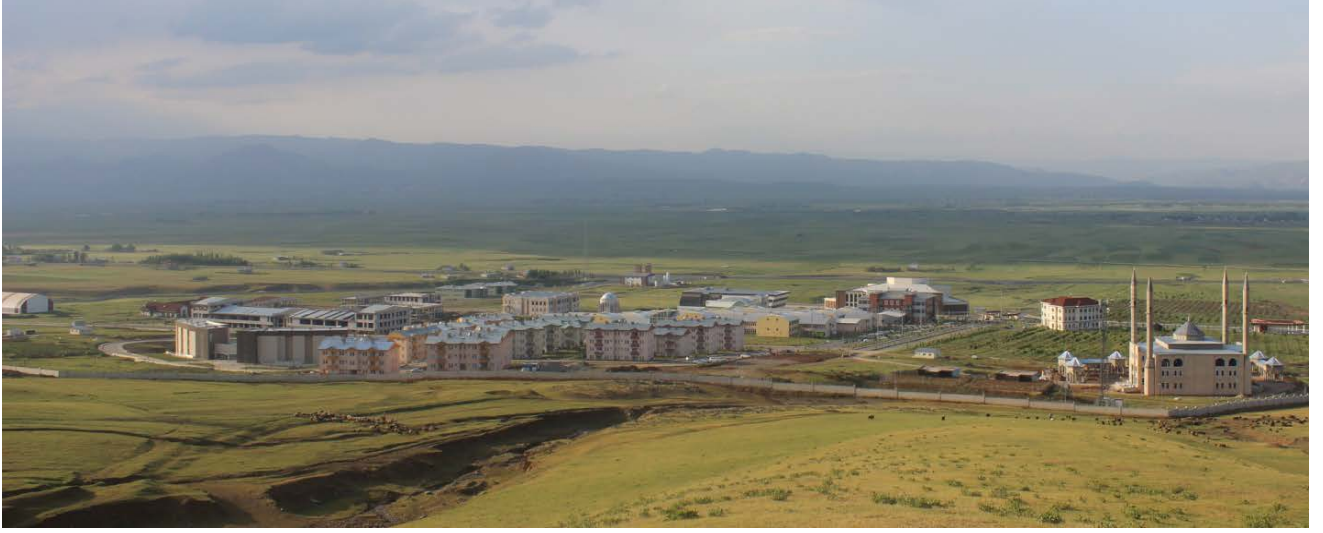
Resim 1. Kampüs Alanı