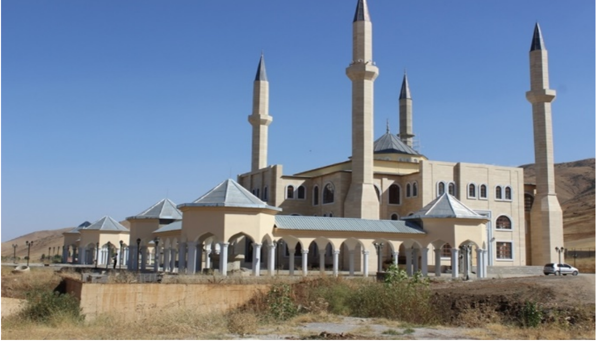
Resim 2. Sultan Muhammed Alparslan Cami

Türkiye Diyanet Vakfı tarafından yapımı üstlenilen Sultan Muhammed Alparslan Cami'sinin, inşaat çalışmaları devam etmektedir.