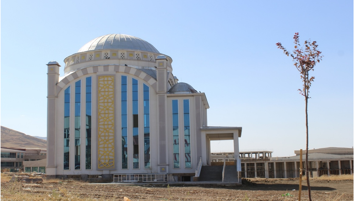
Resim 3. Gazze Cami

Muş Alparslan Üniversitesi Kalkındırma Vakfı tarafından yapımı üstlenilen Gazze Cami'nin inşaat çalışmaları devam etmektedir.